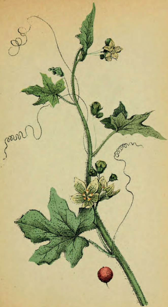
Bryonia dioica L.