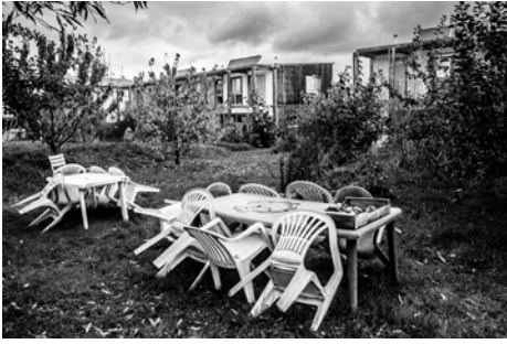
L'habitat collectif, Louvigny Nathalie MASSERON - 1 er Prix