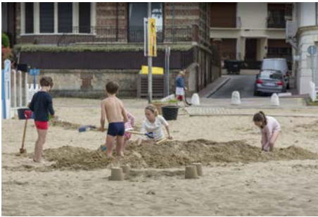
Jouer ensemble, Trouville-sur-Mer Moran FLOC'H - Prix du Jeune Public