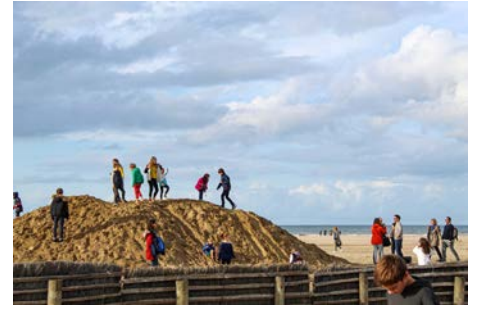
À la montée du sable, Deauville Jade RENARD - Mention