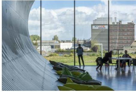
Se cultiver ensemble, Caen Moran FLOC'H - 2 e Prix