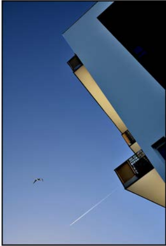
Balcons, Hérouville Jean-François NOEL - 1 er Prix