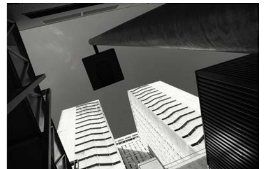
En marche vers l'infini, Caen Moran FLOC'H - Prix du Public