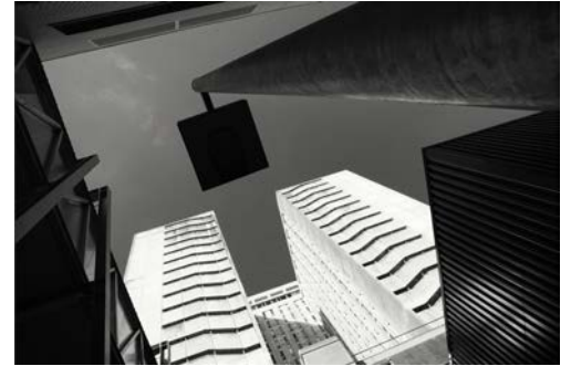
Triste Tétris, Isabelle PIRIOU - Mention du jury pour sa série de photographies