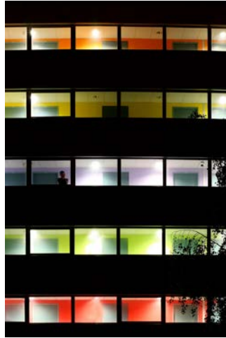
Ultra moderne solitude, Caen Marc FOREL - 2 e Prix