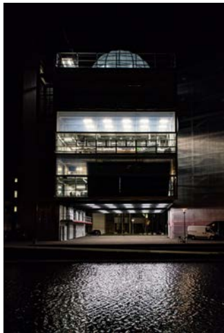
D'ombre et de lumière, Caen Alain MOREL - Mention du jury pour sa série de photographies