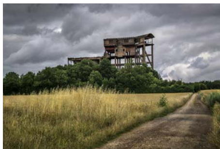
Les chemin des fours, Gouvix Gilbert GUILLOTIN - 2 e Prix