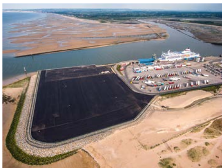
Rupture d'usage, Ouistreham Michel DEHAYE - Mention spéciale