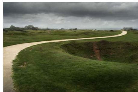
Cicatrices de l'histoire, Cricqueville-en-Bessin Gilbert GUILLOTIN - Mention spéciale