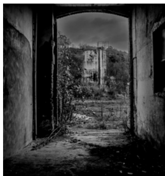
Tannerie abandonnée, Le Mesnil-Villement Henri CARABAJAL - Mention du jury