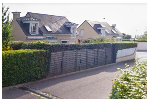
Linéaire de clôtures disparate sur deux propriétés : haie partiellement remplacée par des panneaux bois venant se superposer à un grillage, puis muret enduit.