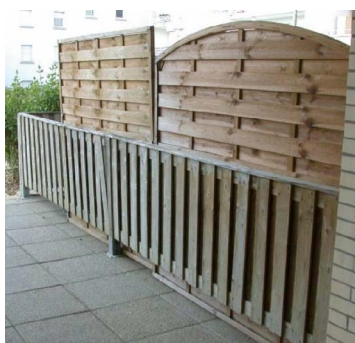
Ajout de panneaux occultants en bois de différentes formes à la clôture initiale.