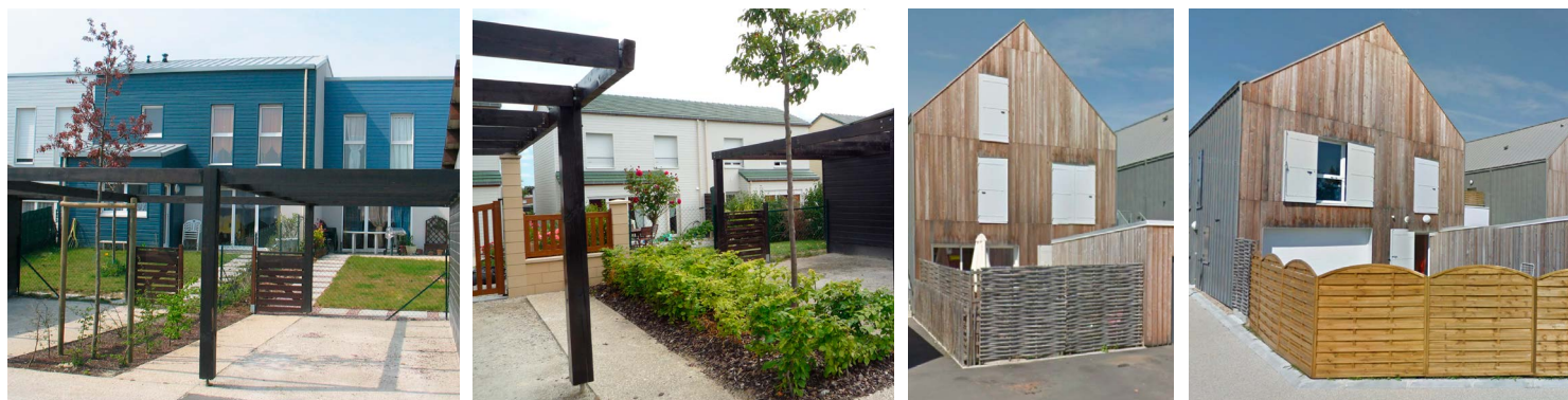
Avant/Après : les nouvelles clôtures sont en rupture totale avec les modèles initiaux tant par leurs formes que par leurs matériaux et teintes.