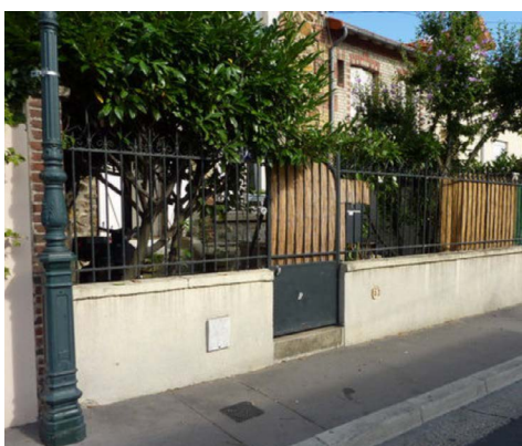
Canisse partielle peu esthétique remplacée par une plaque occultante sans embouts posée à l'intérieur du barreaudage métallique, mais contraste important avec la couleur foncée de la grille. La multiplication de teintes et de matériaux rend plus problématique l'intégration de la clôture.