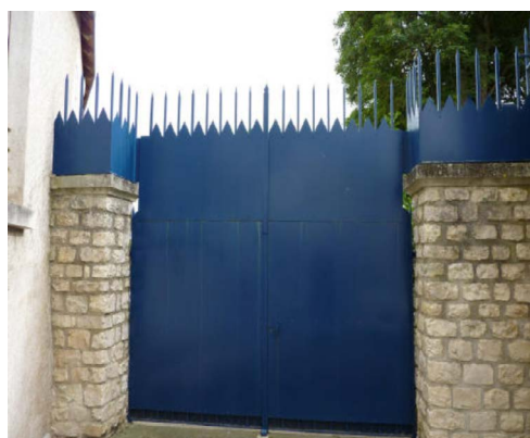
Plaque occultante posée à l'extérieur du barreaudage métallique avec embouts décoratifs surchargés.