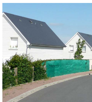
Ajout d'un pare vue de type bâche plastique et de couleur vive posé à l'extérieur d'une clôture végétalisée.