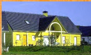
archi. J.P. Marchand - ent. Cuiller

À coût égal, c'est à l'usage que la supériorité du bois se révèle.