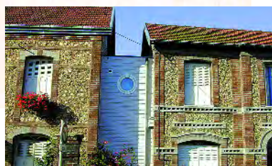
maître d'œuvre L. Callu - ent. C.F.P.

Aujourd'hui, la variété des traitements proposés facilite l'entretien extérieur en offrant une grande gamme d'aspects et de coloris. Les structures en bois garantissent une grande sécurité en cas d'incendie, par leur comportement au feu parfaitement maîtrisé et prévisible que les pompiers considèrent comme "loyal".