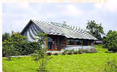
archi. É. Née - ent. Adam

Les maisons anciennes en bois démontrent l'aptitude du matériau à affronter les ans comme les intempéries.