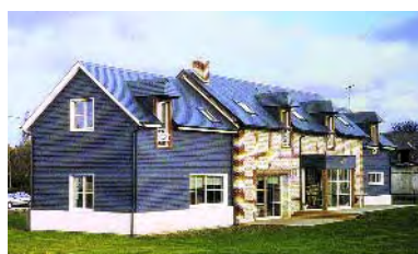
archi. B. Bonhaume - ent. Charpentiers d'Aujourd'hui

La facilité de mise en œuvre des composants bois rend aisé leur assemblage, notamment sur les terrains en pente, difficiles d'accès ou de faible portance.