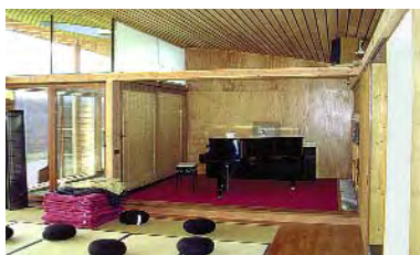
archi. S. Cortesse - ent. Le Toit