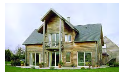
archi. J.J. Poupard - ent. Jouanne-Lefèvre