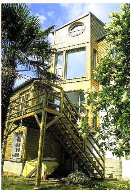
archi. S. Hohl - ent. Sirol-Norisba

la forêt Elle stocke le carbone et absorbe des quantités importantes de CO 2 . Mis en œuvre dans la construction, le bois est le seul matériau à pouvoir peser de façon significative et durable sur un des risques écologiques majeurs qui menacent l'équilibre de notre planète : l'accroissement de l'effet de serre.