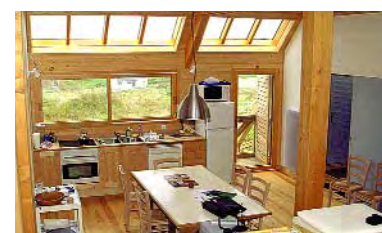
maître d'œuvre F. Pinsard - ent. Jouanne-Lefèvre