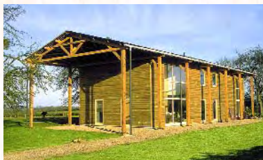
archi. C. Bidaud - ent. Duclos