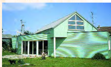
archi. F. Zachariassen - ent. Bachelet

Ses hautes performances d'isolation permettent des économies d'énergie importantes. Les murs n'étant pas froids, ils apportent une sensation de bien-être. Le bois est d'ailleurs reconnu comme un matériau de confort et de santé. D'autre part, les murs moins épais offrent 6 à 7 m 2 supplémentaires pour une maison de 100 m 2 habitables. La rapidité de construction évite souvent de cumuler loyer et remboursement de prêt.